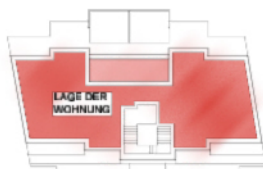
LAGEPLAN 1:750 (2.DACHGESCHOSS)

PENTHOUSE TOP 18: 120.18m 2 (139.76m 2 ) + TERRASSE 17.64m 2